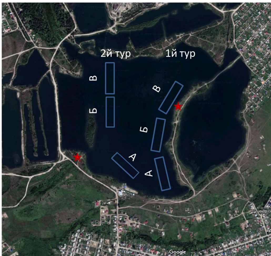
Схема расположения зон. Звездочками обозначены места сбора участников соревнований перед I и II турами.